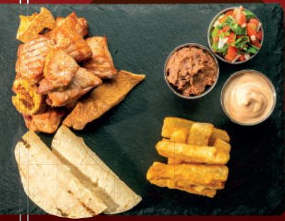
TABLA DE CHICHARRÓN

(Our signature dish is part of the costarican tradition. Our Vegan Chifrijo consists of a generous serving of fried cheese, rice and beans grandma style, pico de gallo, avocado and fried chips)