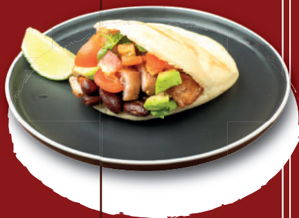
TABLA DE AREPAS

Escoge 3 de nuestras arepas y acompáñalas con Aguacate y salsa (Choose 3 arepas, served with avocado and sauce)